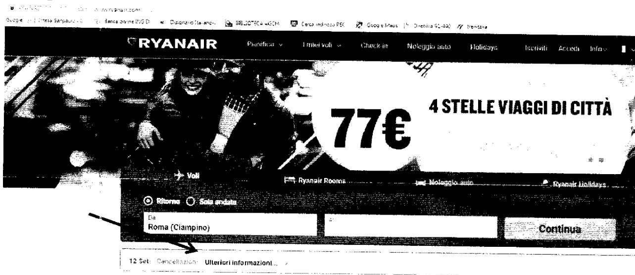
Immagine n. 1

10. Cliccando su detto link si approda ad una diversa pagina web in cui si informano i passeggeri della regolare operatività del volo prenotato a meno che non abbia[no] ricevuto una email di conferma cancellazione (segue la lista dei voli cancellati da martedì 19 Settembre a sabato 28 Ottobre) 5 e si indicano le opzioni a disposizione degli utenti: